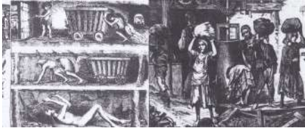
13. Gravure Travail des enfants XIXème siècle En écho au poème : Victor HUGO Mélancholia (1856)