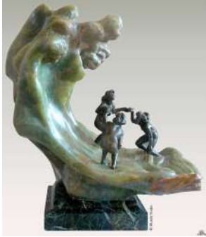
1. Camille CLAUDEL La vague (ou Les baigneuses) (1897-1903)