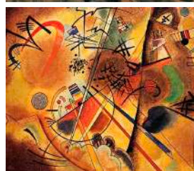
10. Vassily KANDINSKY Petit rêve en rouge (1925)