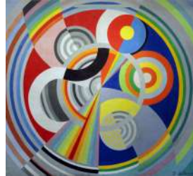
6. Robert DELAUNAY Rythme n°1 (1938)