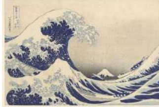
15. Katsushika HOKUSAI La vague (1830)