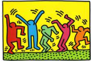
2. Keith HARING La vie est une fête (1980)