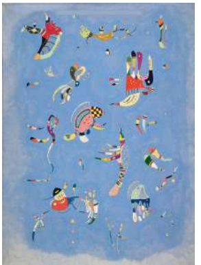
4. Vassily KANDINSKY Bleu de ciel (1940)