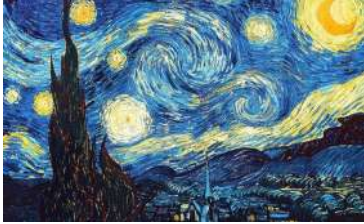
12. Vincent VAN GOGH La nuit étoilée (1889)