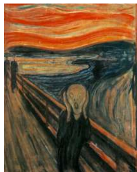
9. Edvard MUNCH Le cri (1893)