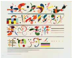
3. Vassily KANDINSKY Succession (1935)