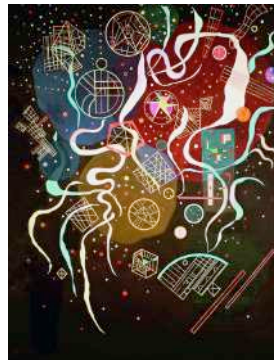
7. Vassily KANDINSKY Mouvement n°1 (1935)