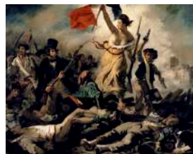
8. Eugène DELACROIX La liberté guidant le peuple (1830)