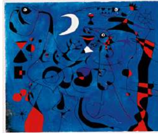
14. Joan MIRO Personnages dans la nuit guidés par des phosphorescentes traces dans la nuit (1940)